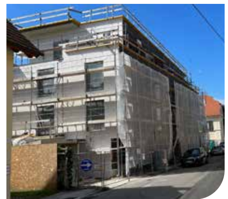
September 2022 - Ansicht Mühlgasse