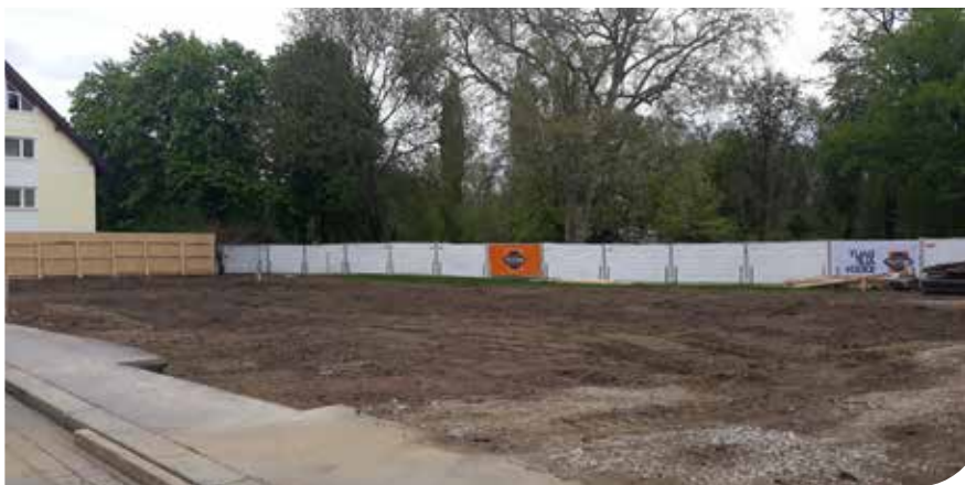
Mai 2021 "Und die Erde war wüst und leer..." - doch das sollte sich rasch ändern.