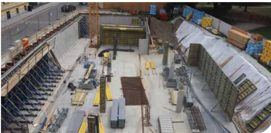
Juli 2021 - Zuerst geht es in die Tiefe und Fundament und Tiefgarage entstehen.