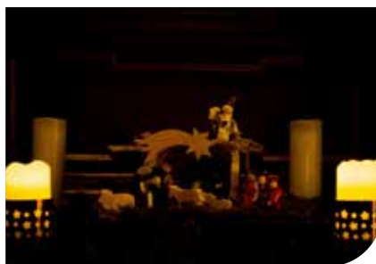
Licht im Dunkeln

Diözesanbischof Wilhelm Krautwaschl ergänzt: „Der Beistand in der Not ist eine der kirchlichen Kernaufgaben. Deshalb möchte die Diözese Graz-Seckau die