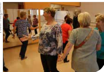
Seniorentanzen in der Kreuzkirche

eine Hilfe zur Alltagsbewältigung. Tanzen macht Spaß und zeigt uns, wie wir das Leben leichter nehmen können.