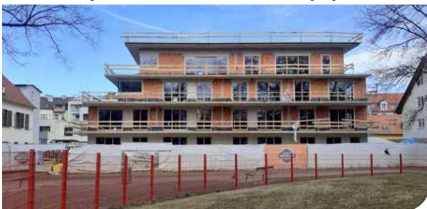
Februar 2022 - Das "Evangelische Haus" vom Volksgarten aus gesehen.